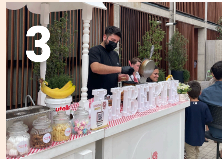
Carrito 3- Dulce y salado

Completos, Churrascos, hamburguesas, Fajitas, Mechadas, Papas Fritas, PopCorn