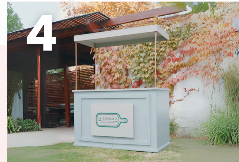
Carrito 4- Picoteos Gourmet

Smash Burger Ingredientes y salsas de autor Papas fritas. y aros de cebolla