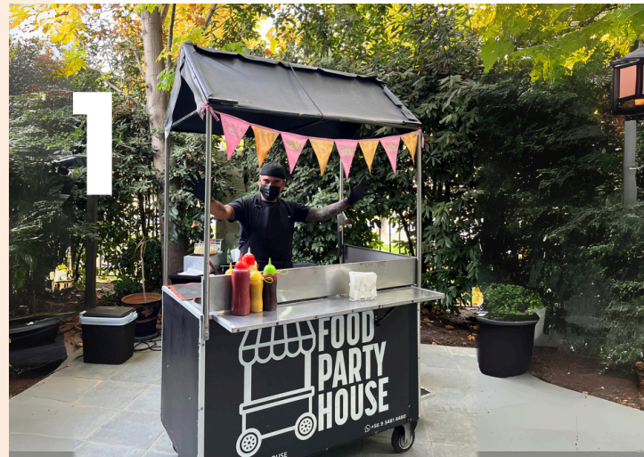
Carrito 1- Clásicos que no pueden faltar

Completos, Churrascos, hamburguesas, Fajitas, Mechadas, Papas Fritas, PopCorn