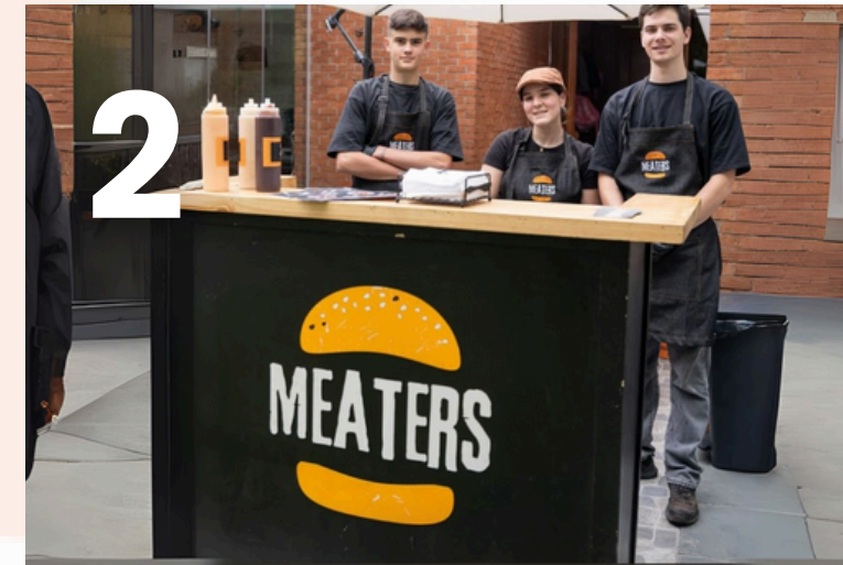
Carrito 2- Expertos en Smash Burger

Salado: Fajitas, churrascos, mechadas, ass, papas supremas, completos, burgers, salchipapas, nuggets, empanadas de queso, sopaipillas con pebre y guacamole Dulce: Waffles, snack bar, churros, frutillas con crema